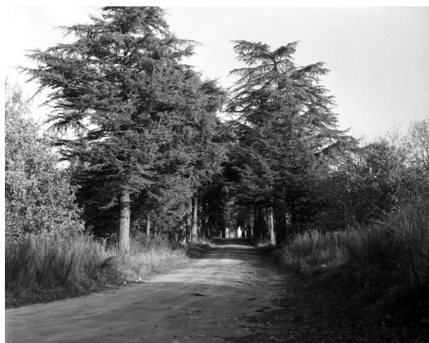
Allée du Calvaire à Sainte-Reine-de-Bretagne en Brière